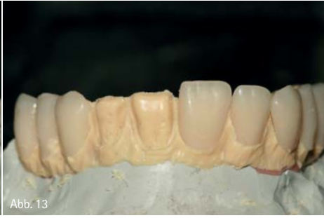
Abb. 7: Die aus PEEK-Material (BioHPP) umgesetzten Primärteile wurden im Fräsgerät auf 0 Grad parallelisiert. – Abb. 8: Prüfen der okklusalen Gegebenheiten im Artikulator (Wachsaufstellung). – Abb. 9: Die für die Gerüstmodellation vorbereitete Oberkieferversorgung (Wachsaufstellung). – Abb. 10 und 11: Modellation der Sekundärstruktur. Ein Steg aus Kunststoff stellte die Basis für die Wachsmodellation. Die im Silikonwall fixierten Verblendschalen wurden mit Wachs aufgefüllt und ein graziles, exakt auf die Situation abgestimmtes Brückengerüst modelliert. – Abb. 12: Wachsmodellation mit den Verblendschalen. – Abb. 13: Die Verblendschalen wurden entfernt und können später auf das BioHPP-Gerüst reponiert werden.

zitätsmodul. Eine hohe Bruchdehnung und hohe Elastizität sowie Schlagfestigkeit sind weitere Fürsprecher. Zu diesen vielen positiven Aspekten war für uns auch die wirtschaftliche Fertigung einer Restauration aus dem Hochleistungspolymer BioHPP ausschlaggebend, um das Material vor sechs Jahren erstmals in unserem Laboralltag einzusetzen. Zum damaligen Zeitpunkt wurde BioHPP beziehungsweise ein auf PEEK-basierendes Material für die prothetische Zahnmedizin von vielen Seiten kritisch beäugt. Wir haben an dieses Material geglaubt, arbeiten seitdem mit sehr positiven Erfahrungen damit und können auf einen langjährigen Erfahrungsschatz zurückblicken.