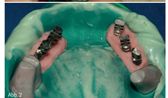
Abb. 1 und 2: Herstellung eines Modells mit Gingivamaske und herausnehmbaren Stümpfen (Molaren).